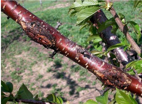
Podolgovate rakaste rane na okuženi veji ( http://msue.anr.msu.edu/news/managing_bacterial_canker_in_sweet_cherries_what_are_the_options )