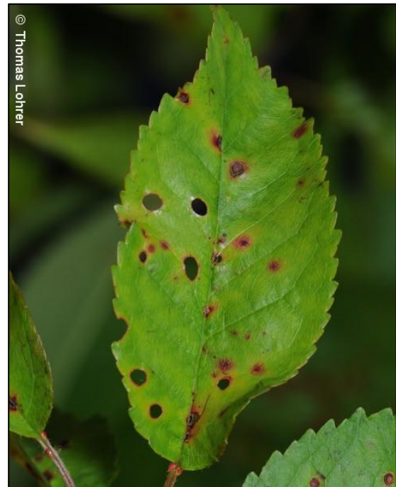
Pege izpadajo in listi dobijo luknjičav izgled