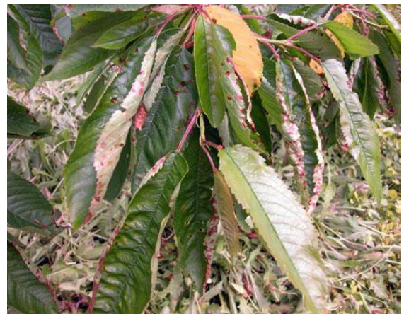
Listi češnje, okuženi z bakterijskim rakom koščičarjev ( http://msue.anr.msu.edu/news/managing_bacterial_canker_in_sweet_cherries_what_are_the_options )