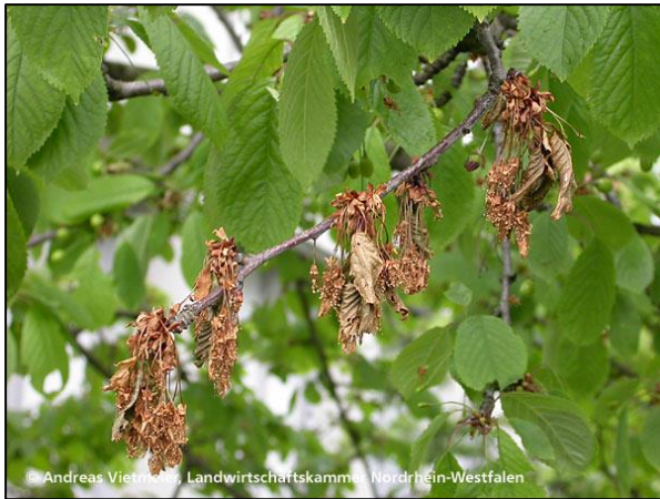
Okuženi cvetni šopi