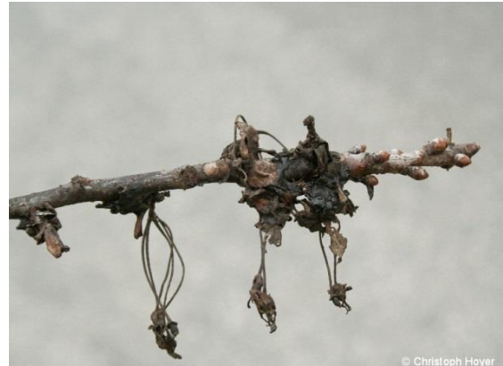
Poganjek češnje s posušenimi okuženimi ostanki cvetov in listov

http://www.apsnet.org/publications/imageresources/Pages/Nov_89-11-3.aspx