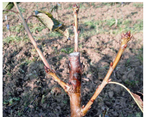
Bakterijski rak se je razvil na prikrajšani sadiki češnje