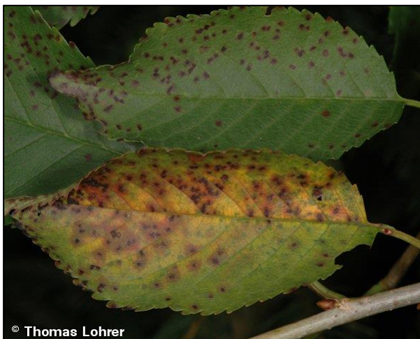
Majhne purpurne pege brez izrazitega roba, ki se med seboj združujejo

Varstvo. Grabljenje in sežiganje okuženega listja. Druga možnost je, da jeseni odpadlo listje poškopimo z ureo, da pospešimo razgradnjo. Učinkovito je predspomladansko škropljenje dreves z bakrovimi pripravki (istočasno s tem zatiramo cvetno monilijo, listno luknjičavost koščičarjev in bakterijski rak). Kasnejša škropljenja so odvisna od obsega že izvršenih okužb in vremenskih razmer (pomembne so predvsem padavine). Prvo škropljenje proti češnjevi listni pegavosti običajno izvedemo skupaj s škropljenjem proti češnjevi muhi. Po obiranju češenj škropljenje izvajamo glede na vremenske razmere, navadno v 14 dnevni razmikih. V letu 2016 so registrirana sredstva: Mankoz, Dithane M45, Merpan in Oktave.