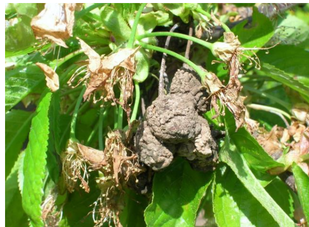
Sadne mumije so zelo pomemben vir okužb