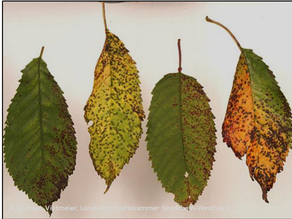
Okuženi listi češnje v različnih fazah razvoja bolezni