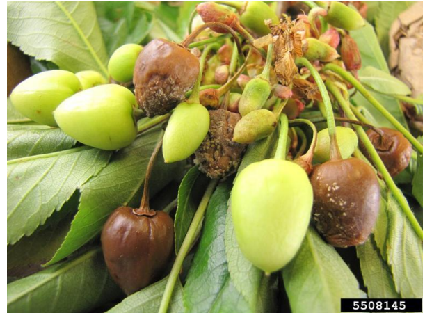
Okuženi zeleni plodiči