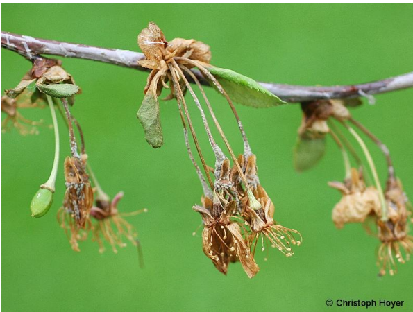
Na posušenih organih se pojavijo sivkaste bradavice - ležišča nespolnih trosov