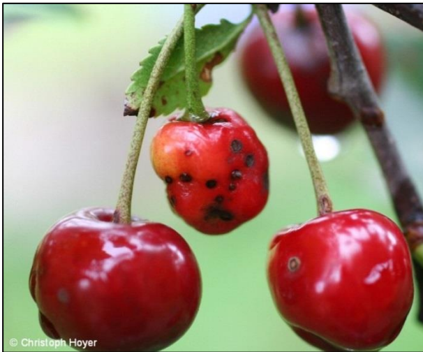
Okuženi plodovi lahko dozoriijo, vendar so izmaličeni