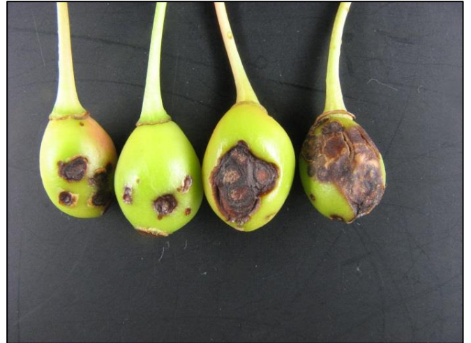
Močno okuženi zeleni plodiči