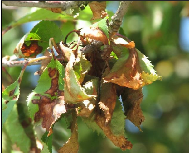
Zaradi okužbe listnega peclja, se lahko posuši cel list