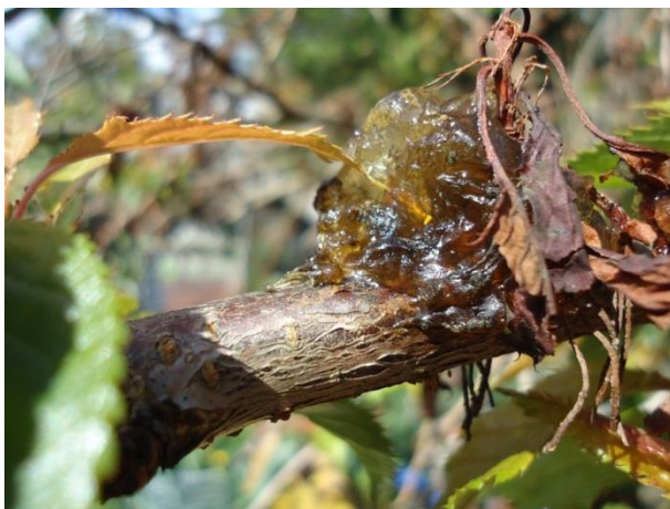
Na okuženih delih se pogosto pojavi smolika ( http://jeanne-lovemygarden.blogspot.si/2012/06/bacterial-canker-on-ornamental-cherry.html )