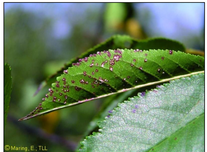
Belkasta ležišča nespolnih trosov na spodnji strani lista