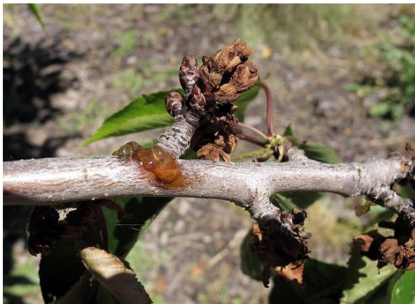
Odmiranje okuženih brstov in smoljenje ( http://utahpests.usu.edu/ipm/htm/advisories/treefruit/article/D=29110 )