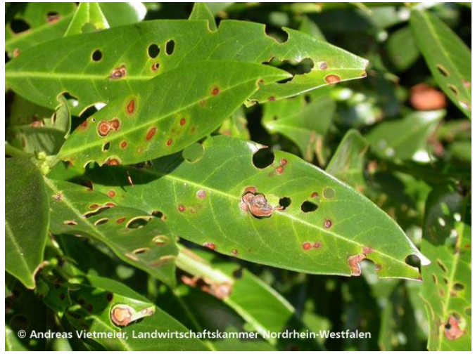
Gliva okužuje tudi lovrikovec