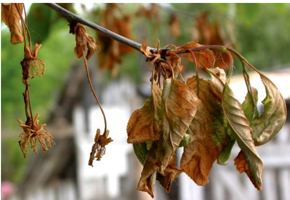
Sušenje cvetov in poganjkov

http://www.apsnet.org/publications/imageresources/Pages/Nov_89-11-3.aspx