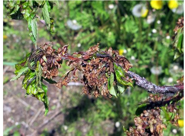
Propadanje cvetnih šopov ( http://msue.anr.msu.edu/news/bacterial_canker_ice_nucleati_on_frost_injury_and_blossom_blast_in_sweet_che )